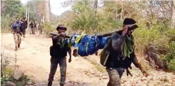
दो जवान घायल, अस्पताल में हुए भर्ती

छत्तीसगढ़ के सुकुमा जिले में शनिवार सुबह सुरक्षाकर्मियों और नक्सलियों के बीच मुठभेड़ हुई है। मुठभेड़ में अब तक 17 नक्सली मारे गए हैं। इंसान और रक्षकसमेत बड़ी मात्रा में हथियार बरामद हुए हैं। मरने वाले नक्सलियों की संख्या बढ़ सकती है। एक साल के अंदर अब तक 410 नक्सली मारे जा चुके हैं।