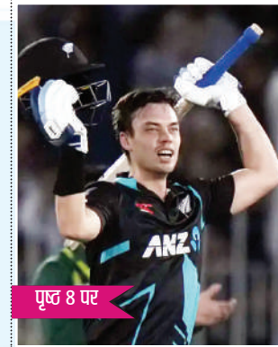
पृष्ठ 8 पर