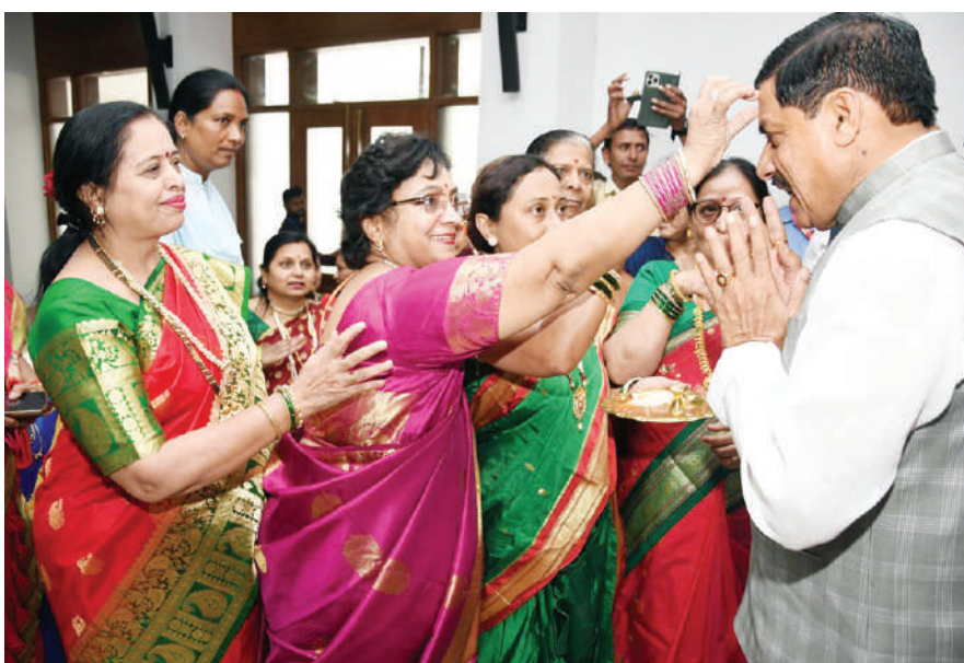
मुख्यमंत्री डॉ. मोहन यादव प्रदेश के वृहद मराठी समाज द्वारा गुड़ी पड़वा के संदर्भ में मुख्यमंत्री निवास के सभागार में आयोजित कार्यक्रम में शामिल हुए। समाज बंधुओं ने चोक और दो छक्के खिला। उनके सिराज-प्रसिद्ध की सटीक गेंदबाजी से जीता गुजरात

मुंबई। स्टैंडअप कॉमेडियन कुणाल कामरा के खिलाफ मुंबई के खार पुलिस स्टेशन में 3 नए केस दर्ज किए गए हैं। ये केस महाराष्ट्र के डिप्टी मुख्यमंत्री एकनाथ शिंदे को लेकर दिए गए विवादित बयान से जुड़े हैं। मुंबई पुलिस की ओर से शनिवार को दी गई जानकारी के मुताबिक, पहली शिकायत जलगांव की मेयर ने दर्ज करवाई है, जबकि बाकी 1-1 केस नासिक के दो अलग-अलग बिजनेसमैन ने किया है। केस में मुंबई पुलिस कुणाल कामरा से पूछताछ के लिए 2 समन जारी कर चुकी है। वहीं महाराष्ट्र विधान परिषद में भी कामरा के खिलाफ विशेषाधिकार हनन का नोटिस स्वीकार कर लिया गया है।